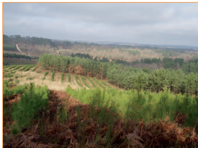
Les jeunes plants ont bien prospéré

Dans l'avenir seule la qualité sera rentable et il convient ici de souligner le travail très satisfaisant accompli par l'équipe technique communale.