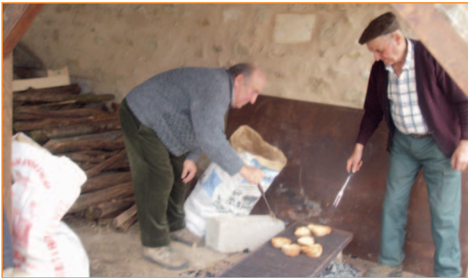
Les organisateurs et bénévoles s'activent pour réchauffer les marcheurs