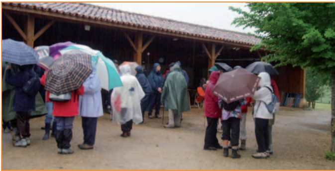
Le mauvais temps n'a pas découragé les randonneurs

Un grand merci donc à tous les participants et aux présidents des associations de randonnée pour leur fidélité.