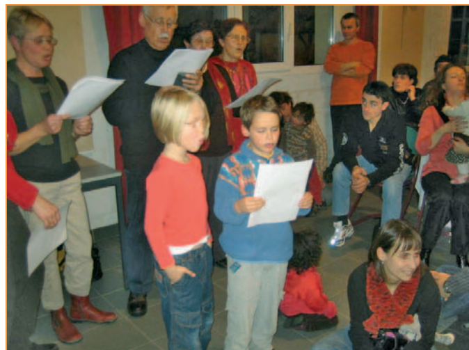
Chants de Noël repris en chœur