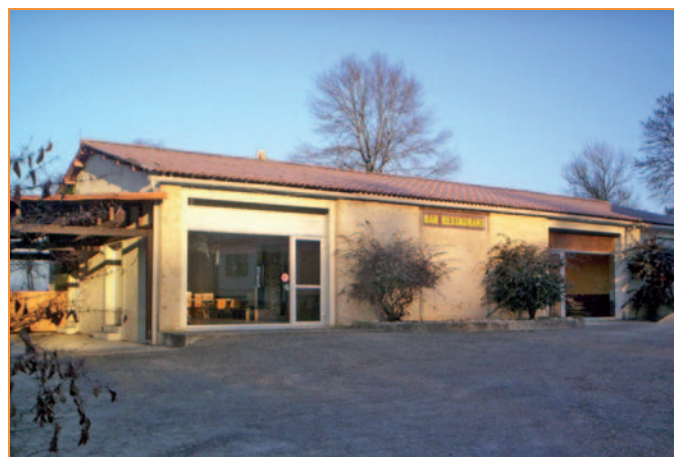
Local Saint Hubert