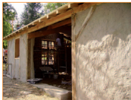
Mur en paille

Les murs de l'atelier, actuellement en bardage bois, seront refaits : la façade ouest (face à la mairie) sera en paille, la façade nord également, l'autre façade sera en bois cordé.