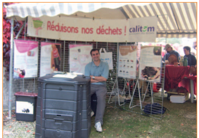
... et aussi sensibilisation au tri des déchets avec le stand de CALITOM