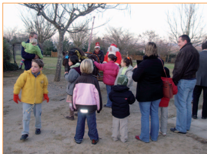
Balades en calèche avec le père Noël

Chants de Noël repris en chœur, distribution de cadeaux et apéritif, les enfants ont été encore gâtés cette année.