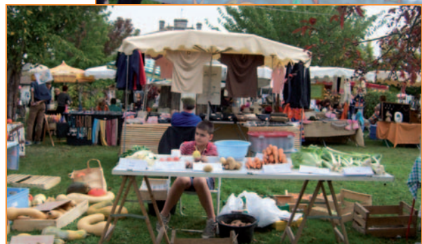
Large place au savoir-faire artisanal...