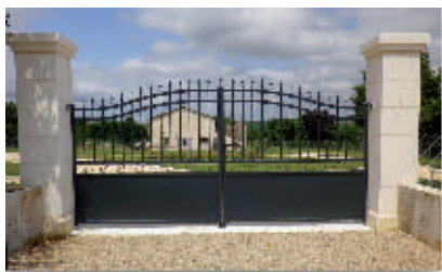
L'entrée du cimetière