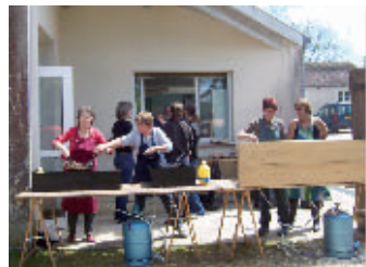
La préparation des fameuses omelettes à l'aillet