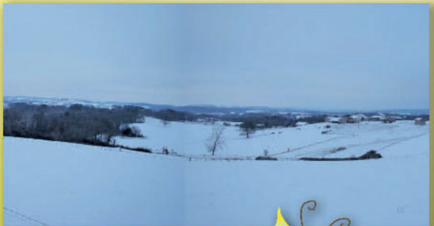
Les paysages de Rioux-Martin, vue depuis la Haute-Lande en février et mai 2012