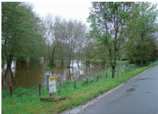
L'eau envahissant les prés le long de l'Argentonne, à l'entrée du bourg de Rioux-Martin, le long de la RD n° 20.

• et des inondations causées par une crue rapide de la Tude, le 29 avril. Ces inondations n'ont causé sur la commune que quelques dégâts agricoles, principalement le recouvrement des parcelles en bordure de l'Argentonne et de la Tude par l'eau. L'étang des Belettes a permis de faire un effet « tampon » en stockant une grande partie des eaux de pluie.