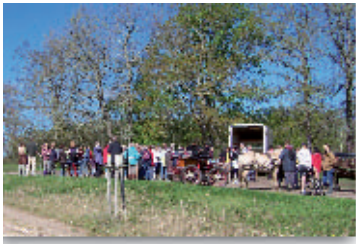
Le ravitaillement bien mérité à l'étang des Belettes